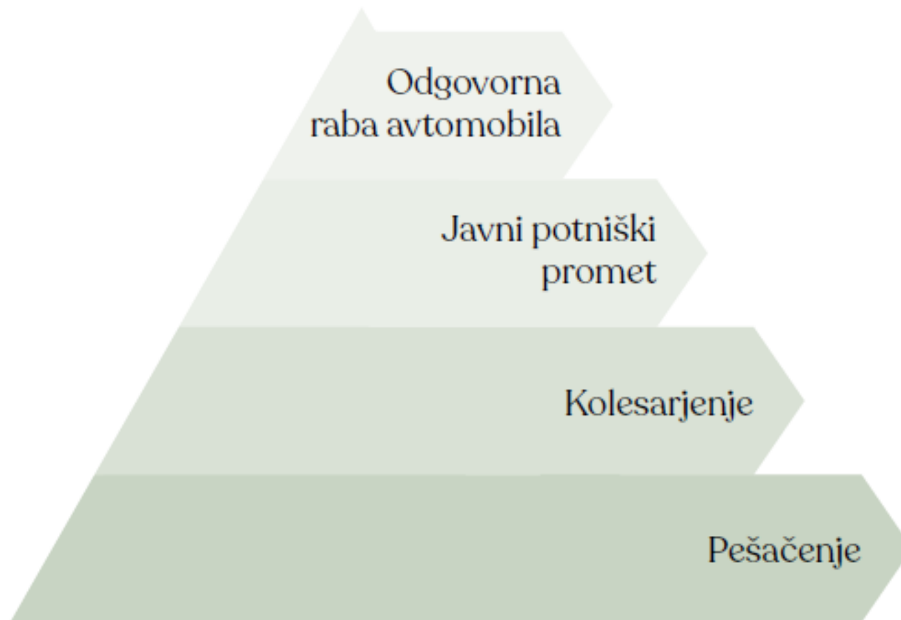
Slika 2: Hierarhija trajnostnih načinov mobilnosti 35